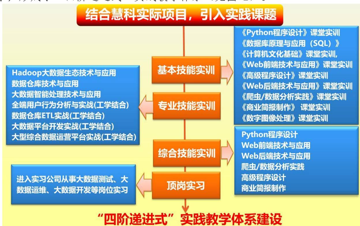
图2 “四阶递进式”实践教学体系

为培养高素质技术型的高职大数据技术人才，体现高职的办学特色，在整个课程体系的设计中，充分利用慧科实训资源，突出实践性教学，形成了“四阶递进式”实践教学体系（见图 2）。